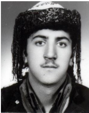
شهید احمد جوانمردی